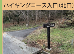
ハイキングコース入口(北口)