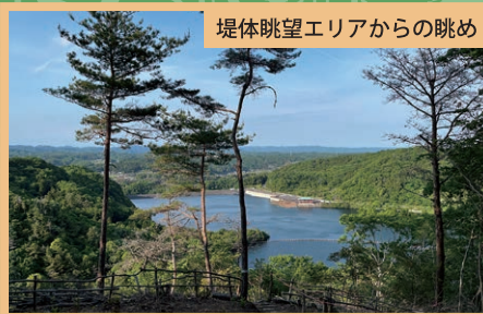
堤体眺望エリアからの眺め