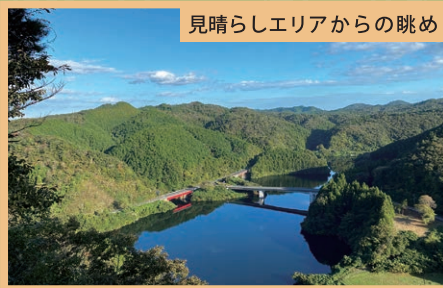
見晴らしエリアからの眺め