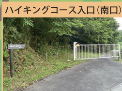
ハイキングコース入口(南口)