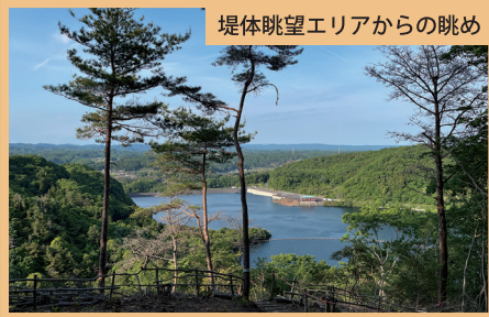
堤体眺望エリアからの眺め