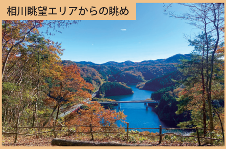
相川眺望エリアからの眺め