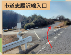
市道志殿沢線入口