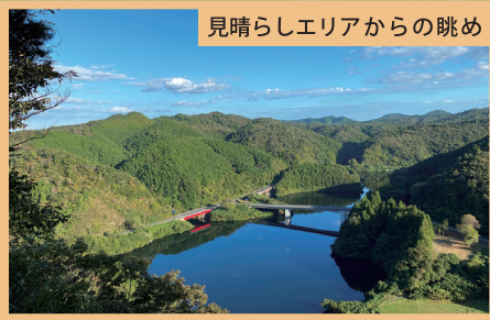
見晴らしエリアからの眺め