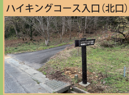
ハイキングコース入口(北口)