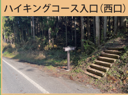
ハイキングコース入口(西口)